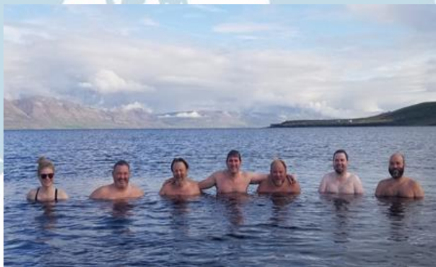
Þátttakendur á gagnafundinum á Akureyri tóku sér smá pásu frá vinnu og skelltu sér í sjósund á Hauganesi við Eyjafjörð.

INTERACT samstarfið hefur nú skilað inn þriðju styrkumsókn sinni til Evrópusambandsins og er Rif aðili að þeirri umsókn.