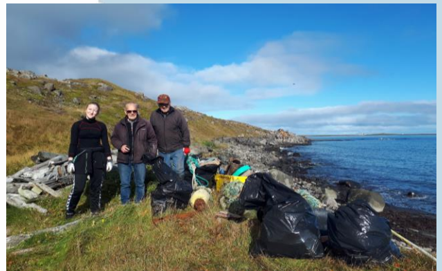
Rannsóknastöðin stóð að strandhreinsun við Raufarhöfn á alþjóðahreinsunardaginn 15. september í samstarfi við Áhaldahúsið á Raufarhöfn og Norðurþing. Á myndinni eru þrjú vaskir þátttakendur með feng dagsins í Klifavík við Raufarhöfn.

Af ýmsu markverðu árið 2018 má m.a. nefna uppsetningu veðurstöðvar á jörð Rifs í september. Styrkur fékkst til kaupa á stöðinni í gegnum INTERACT samstarfsnetið en Veðurstofa Íslands annaðist uppsetningu og mun sinna viðhaldi. Auk hefðbundinna breyta mælir veðurstöðin t.d. jarðvegshita og -raka, grænkun (með NDVI nema), inngeislun og fleira auk þess sem vefmyndavél á stöðinni tekur mynd á klukkutíma fresti. Öll gögn sem stöðin safnar verða aðgengileg almenningi og vísindamönnum á vefsíðu Veðurstofunnar og munu þau vafalaust nýtast vel við rannsóknir og vöktun á Melrakkasléttu.